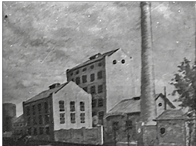
A gyár 1938-ban

Az I. sz. kút 52 m mély, melyből 24 óra alatt 620 m 3 vizet termeltek ki, a II. sz. kút mélyebb, ebből napi 550 m 3 vizet nyertek. A gyár napi vízigénye 1940-ben napi 6250 m 3 , a két kút pedig mindössze 1170 m 3 -t biztosított. A vízhiány a termelést veszélyeztette.