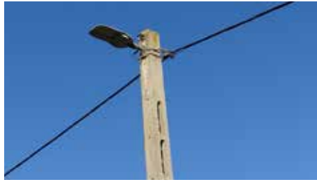
A Fő utca és István utcákban a közvilágítás korszerűsítése befejeződött, napelemes lámpatestek kerültek felszerelésre