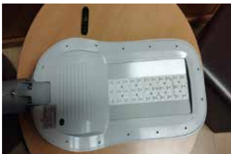
Szabadság tér, Kossuth, Arany János, József Attila, Ady Endre és Jókai Mór utcák közvilágításának korszerűsítése a napokban elkezdődik