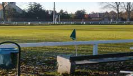
Most hogy vége a szezonnak a foci pálya őszi karbantartására is sor került. A karbantartás sokkal hatásosabbnak ígérkezik, így valószínűleg a tavasz/nyár folyamán nem lesz szükség a pálya karbantartás miatti lezárására. A foci pálya mellé lemez garázst vásároltunk, ami tárolóként üzemel.