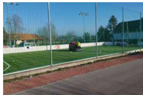
A műfüves focipálya teljes felújítása, részben pályázat, részben önkormányzat általi finanszírozásból