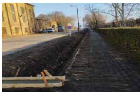
A lakótelepen a veszélyes fák kivágása megtörtént, ezeknek a pótlása megrendelésre került. Az új fák még december folyamán kiültetésre kerülnek a kerítésen belül.