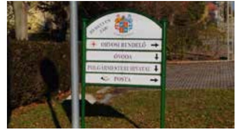
Utca és tájékoztató táblák kicserélésre kerültek