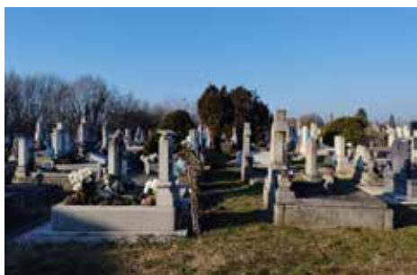
A régi temető rendbe tétele megtörtént, napelemes lámpák kerültek felszerelésre