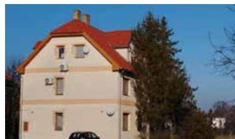
Az István utca 3. szám alatti önkormányzati ingatlan teljes tetőfelújítása