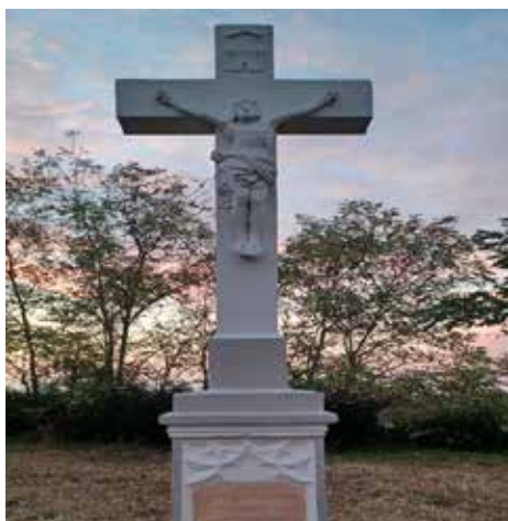
Lászlói temető rendbetétele megtörtént, a kereszt felújításra került