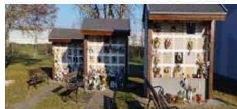
Az urna falak fa szerkezete és az előttük lévő padok lefestése megtörtént