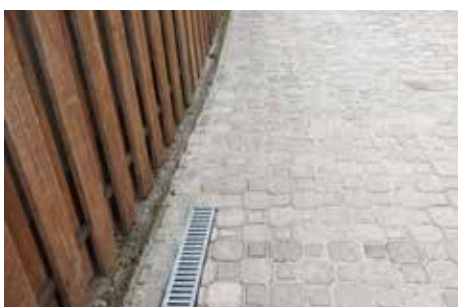
Az üzletháznál lévő térköburkolat felújításra került