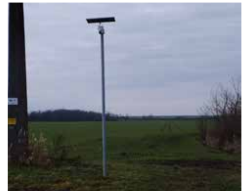
A vízműhöz vezető út mellé napelemes kamera került telepítésre