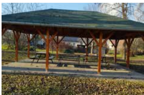
Az ipartelepen megvalósult a fedett közösségi tér, pavilon kialakítása, ahol már számos program meg is valósult