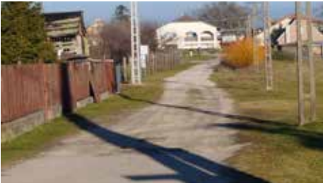
A Fő utcát és Báthori utcát összekötő földút kő burkolatot kapott, a hosszú évek várakozása után végre ezen az útszakaszon is teljes a közvilágítás