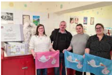
Az idei évben is minden szabadegyházi újszülött családjának átadásra kerültek a babamama csomagok