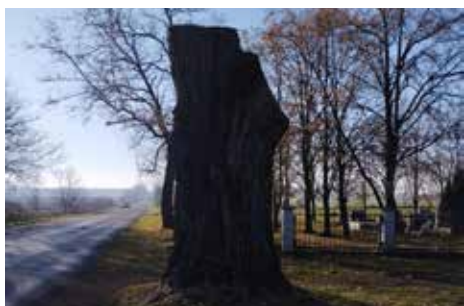
Az új temetőnél található veszélyes fa kivágásra került