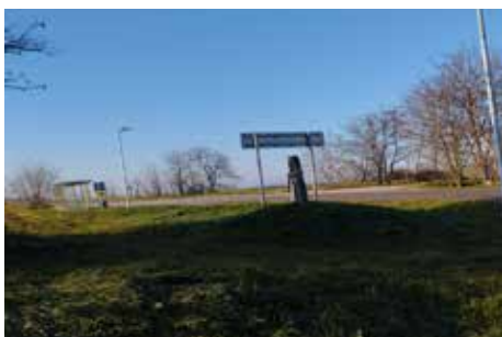
Napelemes közvilágítás telepítése a Vasútállomástól a régi 62-es főútig, illetve az ott lévő buszmegállóknak, ezzel biztonságosabbá téve a közlekedést