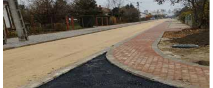
A 2024-es évben a legnagyobb beruházás a településen a Vörösmarty utca teljes felújítása