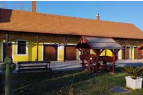
A Nedeczky-Gribsch kastély teljes homlokzata és nyílászárói felújításra kerültek, szúnyoghálókat kerültek felszerelésre az ablakokra