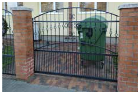
A tolókapu felszerelésre került, a kapu folytatásában térkövezés valósult meg, annak érdekében, hogy a szeméttároló edényt ne az utcán kelljen tárolni