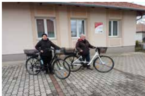
A családsegítő szolgálat munkatársai elektromos kerékpárokat kaptak az Önkormányzattól, ami lehetővé teszi számukra a kényelmesebb és gyorsabb ügyintéztést