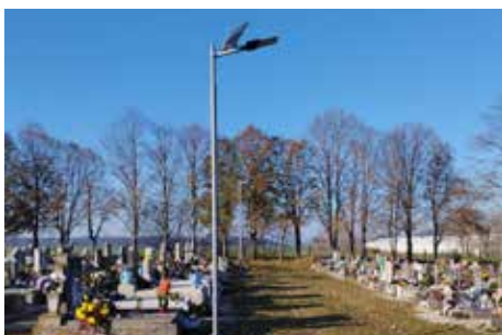
Új napelemes lámpák lettek kihelyezve