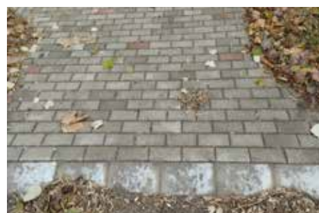
A gyár előtti gyalogátkelőhelynél a járda térkövezésre került