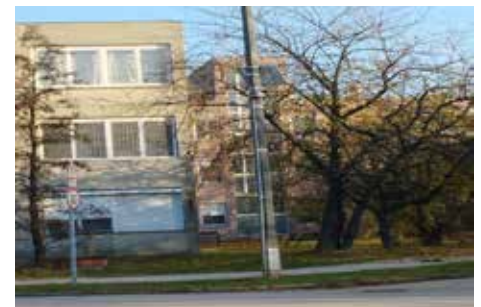
A Thán Károly lakótelepen tavasszal megkezdett közvilágítás korszerűsítése befejeződött