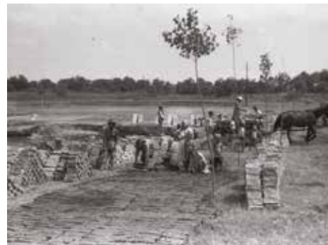
Vályogvetés az István utcában

Az 1950-es időszak után a lakóépületek szilárd alappal és szigeteléssel épültek fel, de a fő falak túlnyomó része még mindig vályogból, vert földből és készültek.