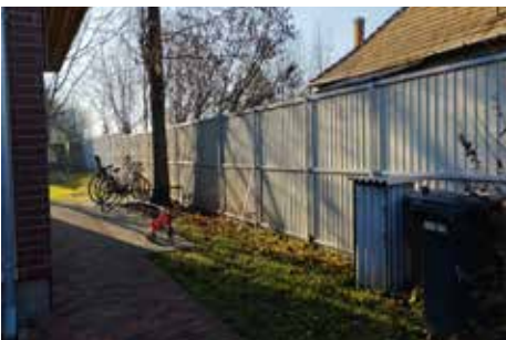
Az óvoda József Attila utcai kerítésének teljes felújítása, megtörtént, a kerékpártároló elkészült