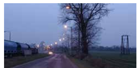
A Hungrana előtti közvilágítás megjavítása befejeződött. Több villanyoszlopnál kábelszakadás miatt kábel cserére volt szükség, ez a kivitelezés idejét megnövelte